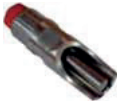
Chupete para madres y cebos