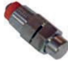
Chupete para aspersión