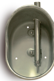
De inoxidable, para lechones, cebo y madres