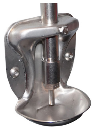
De inoxidable, para primera edad