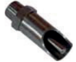
Chupete para maternidad