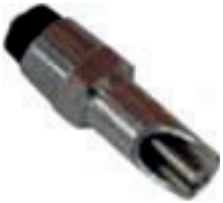
Chupete para destete