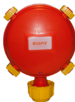
Válvula de nivel constante