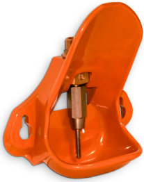
De PVC, para primera edad y destete