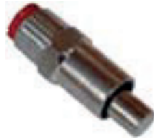
Chupete para tolva de cebo