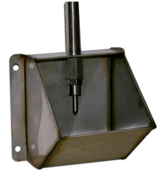
De inoxidable, para lechones, cebo y madres