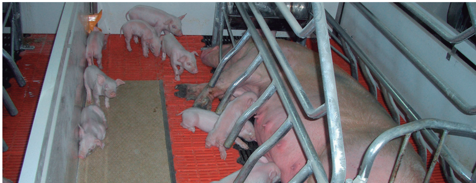
Placa eléctrica en hormigón Polímero para maternidad. Encastrar auto-portante.