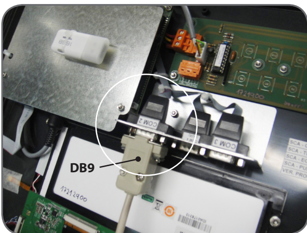
Img. 02. Conexión DB9 al COM2 de la tapa del SCA.